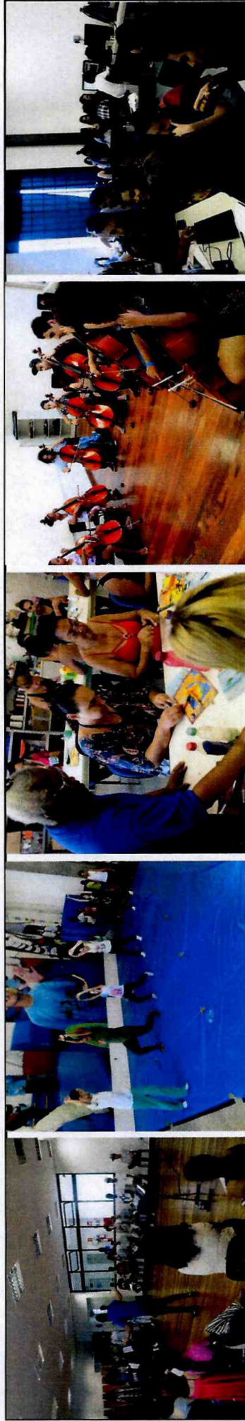
Canto Coral - CFC Vila Curuça

Itens: 14, 15, 16, 17 e 18: Neste trimestre, todas as Fábricas de Cultura atingiram as metas adequadamente, com exceção da Fábrica de Cultura Cidade Tiradentes que, no meio do trimestre, readequou a turma do Ateliê de Criação de Sopro Metais para uma Trilha de Produção de Longa Duração, devido à pouca demanda por este curso na carga horária oferecida pelo Ateliê. Esta alteração impactou também o número de vagas ofertadas.