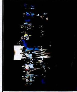
Preparação corporal - CFC Cid. Tiradentes