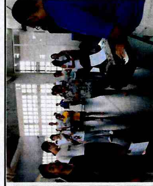
Preparação musical - CFC Sapopemba