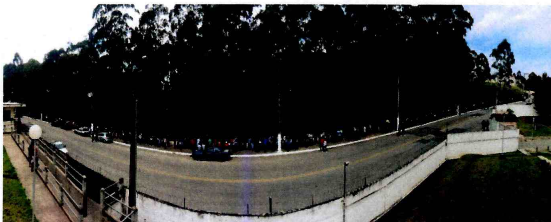
Fila de cerca de 1,5 km para atendimento na FC Cid. Tiradentes

Mais de 2 mil vagas para estágio e 900 vagas para jovem aprendiz foram oferecidas aos 3.300 candidatos que compareceram à Fábrica de Cultura Cidade Tiradentes. A ação também proporcionou a orientação profissional e oferta de cursos de capacitação para os presentes.