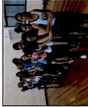
Jogo teatral - CFC Vila Curuça

Item 37: Informamos o número de matriculados para acompanhamento, porém esta meta apenas é contabilizada no segundo semestre, por ser uma ação anual.