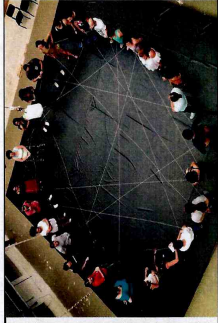
Formação por Fábrica: equipe Parque Belém