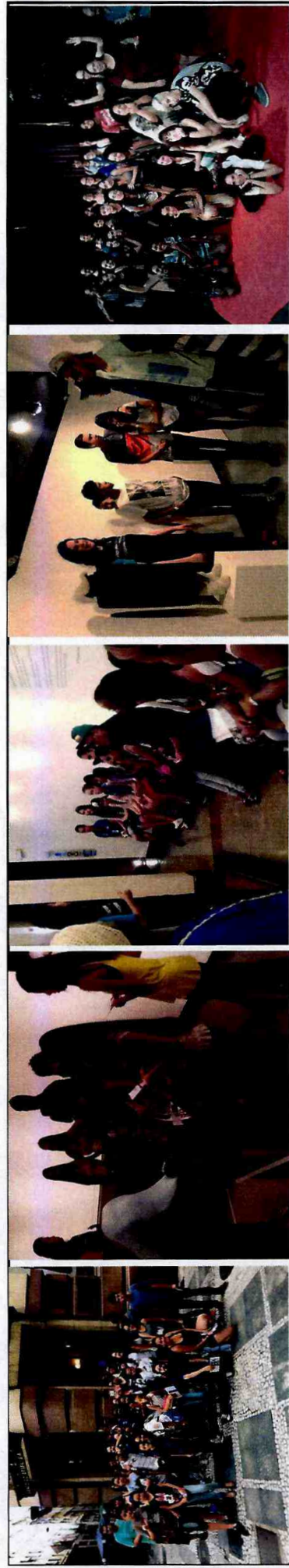
Exposição no CCBB "A Casa e o Corpo" - CFCs Vila Curuça, Sapopemba, Itaim Paulista e Cidade Tiradentes

As metas foram realizadas adequadamente em todas as Fábricas.