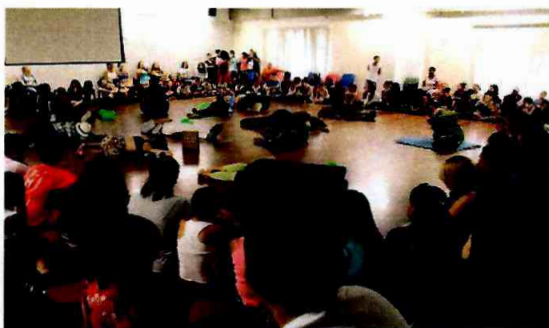
Fábrica de Cultura Cid. Tiradentes

Das diversas atividades desenvolvidas pelas Fábricas de Cultura Vila Curuçá, Sapopemba, Itaim Paulista, Parque Belém e Cidade Tiradentes, destacamos: