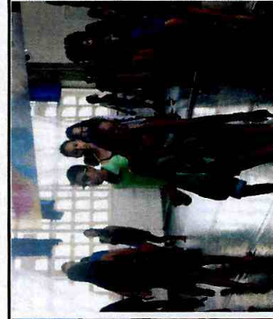
Preparação corporal - CFC Itaim Paulista