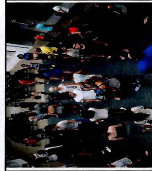
Preparação corporal - CFC Parque Belém