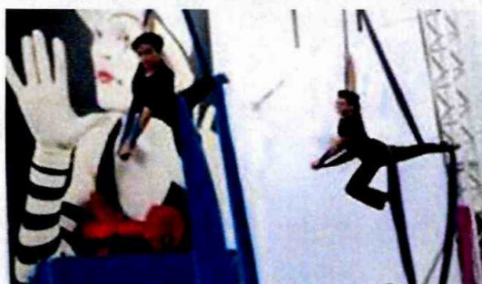
Fábrica de Cultura Vl. Curuçá

produzidas para integrar os aprendizes ao espaço e às equipes que trabalham em cada uma das unidades.