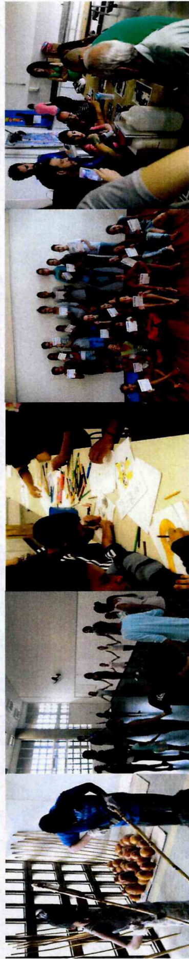
Conserto e manutenção de berimbaus - CFC Vila Curuçá

Itens 40, 41 e 42: Em relação aos Cursos de Férias, o número de vagas foi superado nas Fábricas de Vila Curuçá, Sapopemba e Cidade Tiradentes devido às especificidades dos cursos oferecidos, que comportavam um número maior de aprendizes. Quanto ao número de vagas ocupadas (matriculados) as Fábricas de Sapopemba, Cidade Tiradentes e Parque Belém, devido à maior procura, superaram a meta.