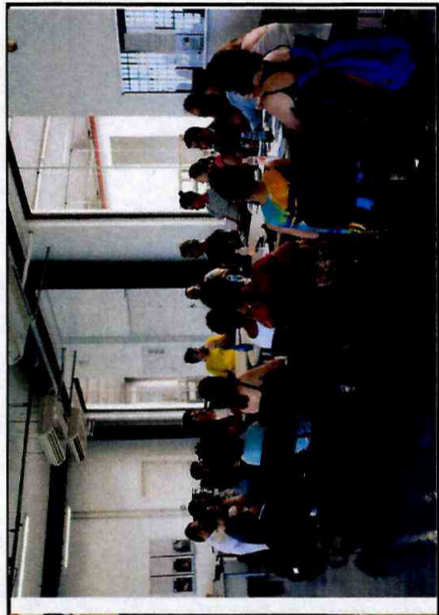
Reunião com as equipes do Projeto Espetáculo