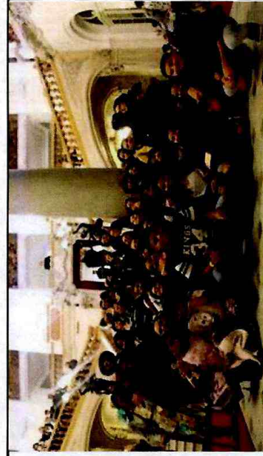
Museu de Arte Contemporânea: Exposição "A Casa" - CFC Vila Curuçá; Instituto Tomie Ohtake: Exposição - Yoko Ono - CFC Itaim Paulista; Teatro Municipal - Balé da Cidade - CFC Cid. Tiradentes