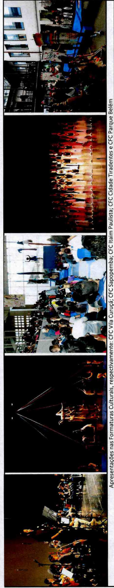
Apresentações nas Formaturas Culturais, respectivamente: CFC Vila Curuçá; CFC Sapopemba; CFC Itaim Paulista; CFC Cidade Tiradentes e CFC Parque Belém

Itens 14 e 16: todas as Fábricas de Cultura atingiram as metas adequadamente, com exceção da Fábrica de Cultura Cidade Tiradentes que readequou a turma do Atelié de Criação de Sopro Metais para uma Trilha de Produção de Longa Duração, devido à pouca demanda por este curso na carga horária oferecida pelo Atelié. Esta alteração impactou também o número de vagas ofertadas. Item 15: A superação do número total de matriculados, em todas as Fábricas, justifica-se devido à grande procura pelas atividades oferecidas e devido ao processo de evasão que permite a reposição de aprendizes. Esta superação não impactou custos adicionais pois ocorreu apenas a reposição de aprendizes e utilização dos recursos já previstos para a oferta de vagas.