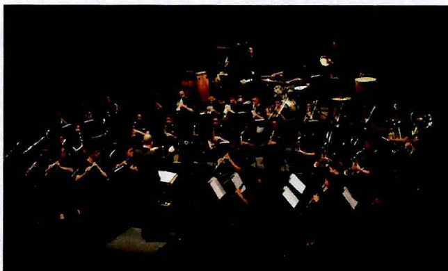
Apresentação da Banda Sinfônica – junho de 2017

Até 2016 o Projeto Musicando formou conjuntos musicais nas Fábricas de Cultura da zona leste a partir dos trabalhos realizados nos Ateliês de Criação e Trilhas de Produção. Em 2017, surge o momento de aproximar os aprendizes dessas Fábricas, além de receber jovens de toda a cidade de São Paulo que já possuam iniciação musical, para um ciclo de aprofundamento artístico, concentrado na Fábrica de Cultura Sapopemba, formando os seguintes conjuntos musicais: Orquestra de Cordas, Banda Sinfônica e Orquestra Sinfônica.