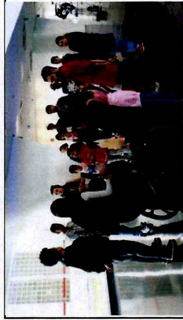
Museu de Arte Contemporânea: Exposição "A Casa" - CFC Vila Curuçá; Instituto Tomie Ohtake: Exposição - Yoko Ono - CFC Itaim Paulista; Teatro Municipal - Balé da Cidade - CFC Cid. Tiradentes

Itens 12 e 13: metas atingidas adequadamente.