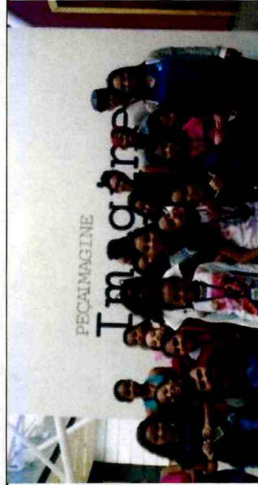
Museu de Arte Contemporânea: Exposição "A Casa" - CFC Vila Curuçá; Instituto Tomie Ohtake: Exposição - Yoko Ono - CFC Itaim Paulista; Teatro Municipal - Balé da Cidade - CFC Cid. Tiradentes