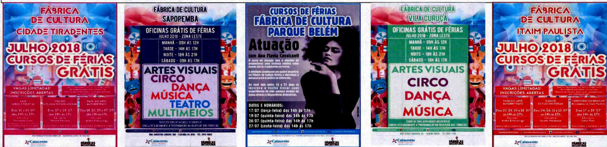
Material gráfico para divulgação das Oficinas e dos Cursos de Férias

Neste trimestre fizemos a divulgação das oficinas e cursos de férias que acontecerão em julho de 2018.