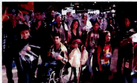
Sesc Pompéia: Exposição Lugares do Delírio - CFC Itaim Paulista