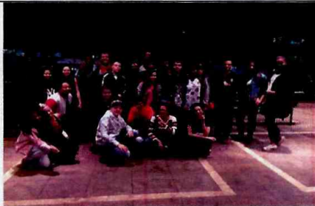
Teatro Alfa: Peter Pan - O Musical - CFC Vila Curuçá

ITEM 6.1 e 6.2: Considerando a grande oferta de convites para Musicais renomados, neste trimestre, foi realizada uma saída a mais por Fábrica, com exceção de Itaim Paulista, cuja localização é a mais afastada do centro e devido aos horários tardios dos espetáculos. Essas saídas não tiveram impacto significativo no orçamento, pois para três delas recebemos gratuitamente o transporte do Centro Cultural Banco do Brasil. A superação de participantes atendidos reflete o número de saídas realizadas.