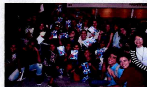
Teatro Flávio Império: Heurói Núcleo Luz - CFC Cid. Tiradentes