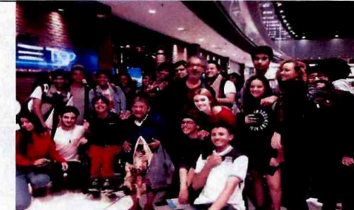
Theatro Net: Chaplin - Musical - CFC Parque Belém