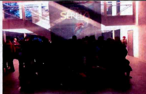
Teatro Santander: A Pequena Sereira - O Musical - CFC Sapopemba