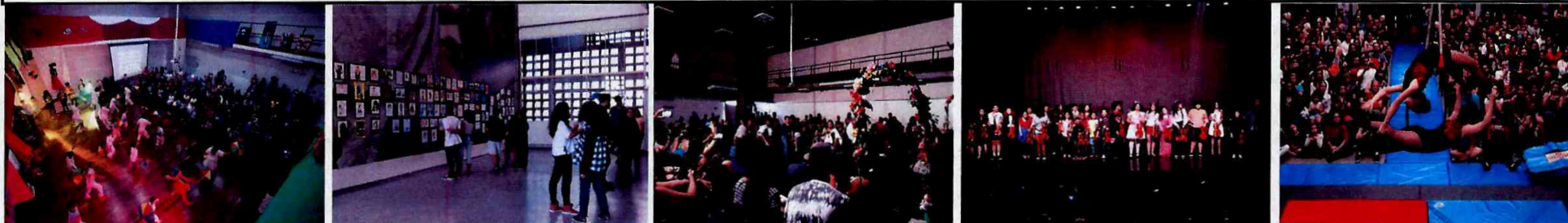
Apresentação dos Ateliês de Criação na Formatura Cultural do 1º semestre de 2018, respectivamente: CFC Vila Curuçá, CFC Sapopemba, CFC Itaim Paulista, CFC Cidade Tiradentes e CFC Parque Belém

ITEM 7.2: A superação da meta de n° de matriculados nas Fábricas de Vila Curuçá, Cidade Tiradentes e Parque Belém justifica-se pela grande procura das atividades oferecidas e devido ao processo de evasão, que permite a reposição de aprendizes. Esta superação não impactou custos adicionais pois ocorreu a utilização dos recursos já previstos para a oferta de vagas.