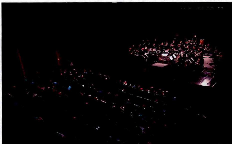
15.05 - Apresentação da Banda Sinfônica

Nos dias 15, 16 e 19 de maio, a Banda Sinfônica, a Orquestra de Cordas e a Orquestra Sinfônica das Fábricas de Cultura da zona leste estrearam os concertos da temporada 2018. Neste ano, o Projeto Musicando dá continuidade ao processo artístico construtivo por meio das Danças e Ritmos Brasileiros. Foi investigada a produção intelectual nacional de compositores que nos trazem uma poética musical, revelando formas musicais no discurso do poema, da serenata, de danças folclóricas e populares brasileiras e europeias, entre outras, trazendo um panorama da música construída desde o período barroco aos dias de hoje. As apresentações contaram com a presença de familiares, da comunidade e de interessados na proposta, tirando aplausos de toda a plateia.